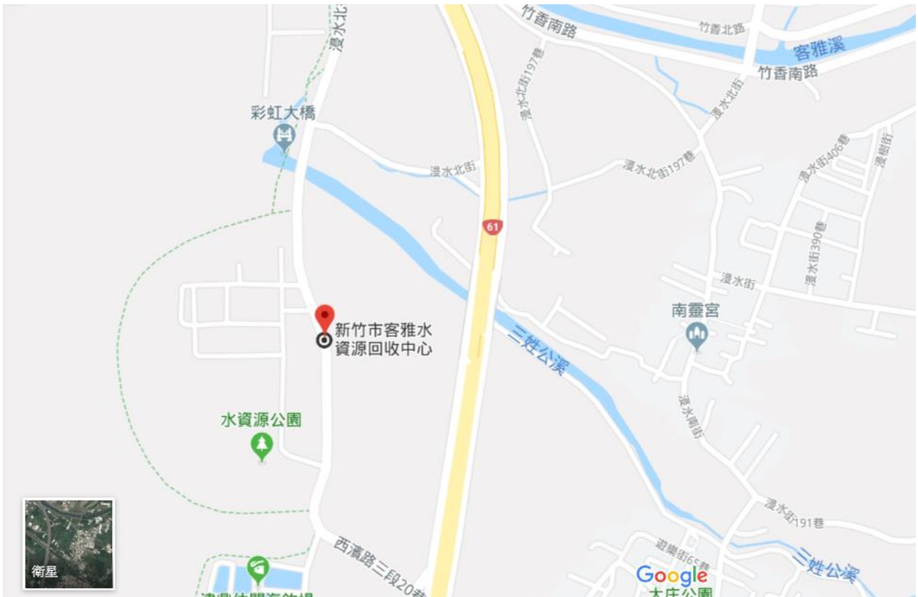
新竹市客雅水資源回收中心(環境教育中心)位置示意圖